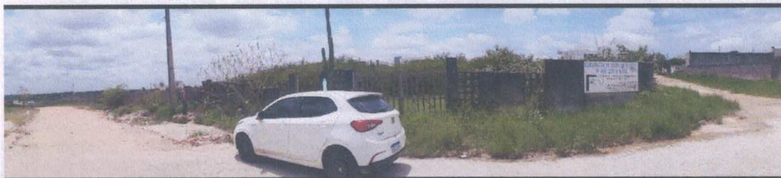
Figura 01: Vista do terreno Estrada Coité Juazeirinho (BA 411) e Rua Ivan Assis Dantas