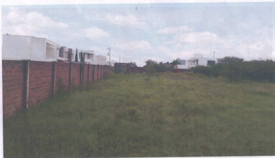
Figura 03: Vista do terreno