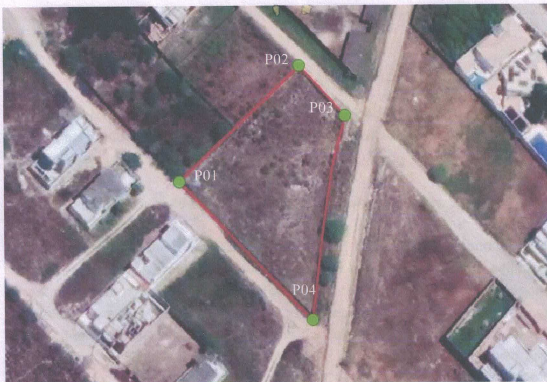
Figura 04: Coordenadas do Terreno

O terreno está representado em planta com as seguintes coordenadas geográficas em UTM: P1 (8720621,17; 469143,58), P2 (8720644,58; 469151,09), P3 (8720722,87; 469149,72), P4 (8720621,35; 469103,25).