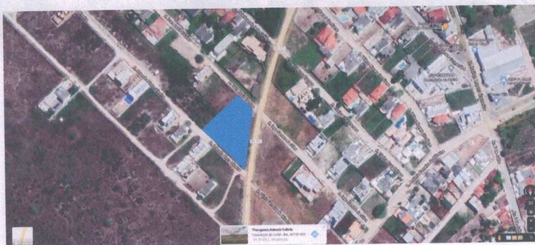
Figura 04: Localização do terreno