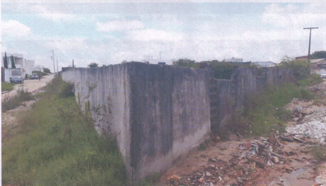
Figura 02: Vista do terreno Estrada Coité Juazeirinho (BA 411) e Rua Orlando Pinto Oliveira